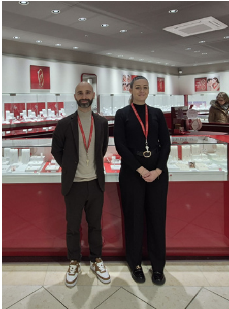
*commande en ligne et retrait sur place